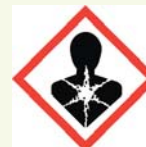
Peligro para la salud

¡Preste atención a símbolos como éstos y haga preguntas!