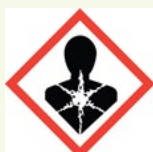
Peligro para la salud

¡Preste atención a símbolos como éstos y haga preguntas!